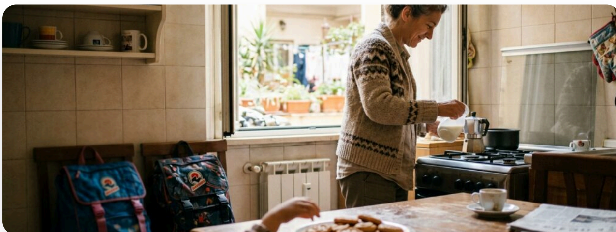
Una colazione qualunque. È nei gesti piccoli che l'accoglienza prende casa.

Mai. Educatori, assistenti sociali e altre famiglie camminano con te. L'affido è una scelta di comunità.